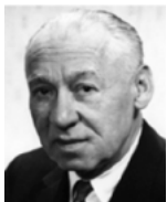
Ladislav Meduna 1896–1964

Ladislav Meduna untersuchte in den 1930er Jahren an der psychiatrischen Klinik in Budapest die Wirkung von generalisierten Anfällen, die er durch Injektion von Kampfer auslöste, zunächst im Tierversuch und ab 1934 bei schizophrenen Patienten. Hieraus entwickelte er die pharmakologische Konvulsionstherapie. Sie eröffnete eine völlig neue Perspektive für die Behandlung schwerer psychischer Erkrankungen.