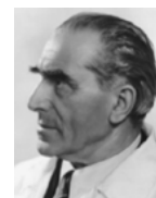
Ugo Cerletti 1877–1963

Ladislav Meduna untersuchte in den 1930er Jahren an der psychiatrischen Klinik in Budapest die Wirkung von generalisierten Anfällen, die er durch Injektion von Kampfer auslöste, zunächst im Tierversuch und ab 1934 bei schizophrenen Patienten. Hieraus entwickelte er die pharmakologische Konvulsionstherapie. Sie eröffnete eine völlig neue Perspektive für die Behandlung schwerer psychischer Erkrankungen.